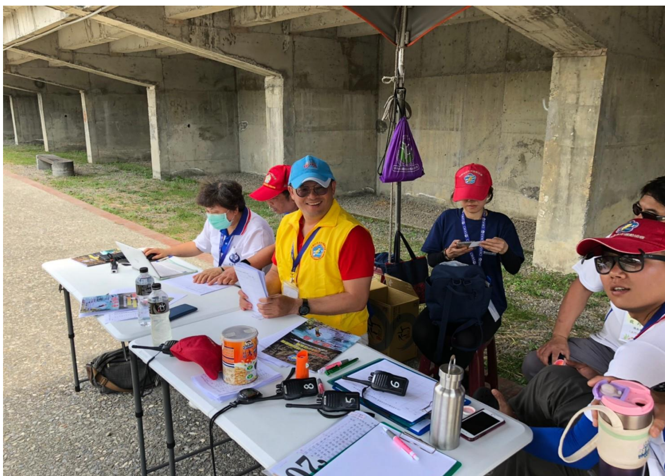
終點裁判紀錄成績