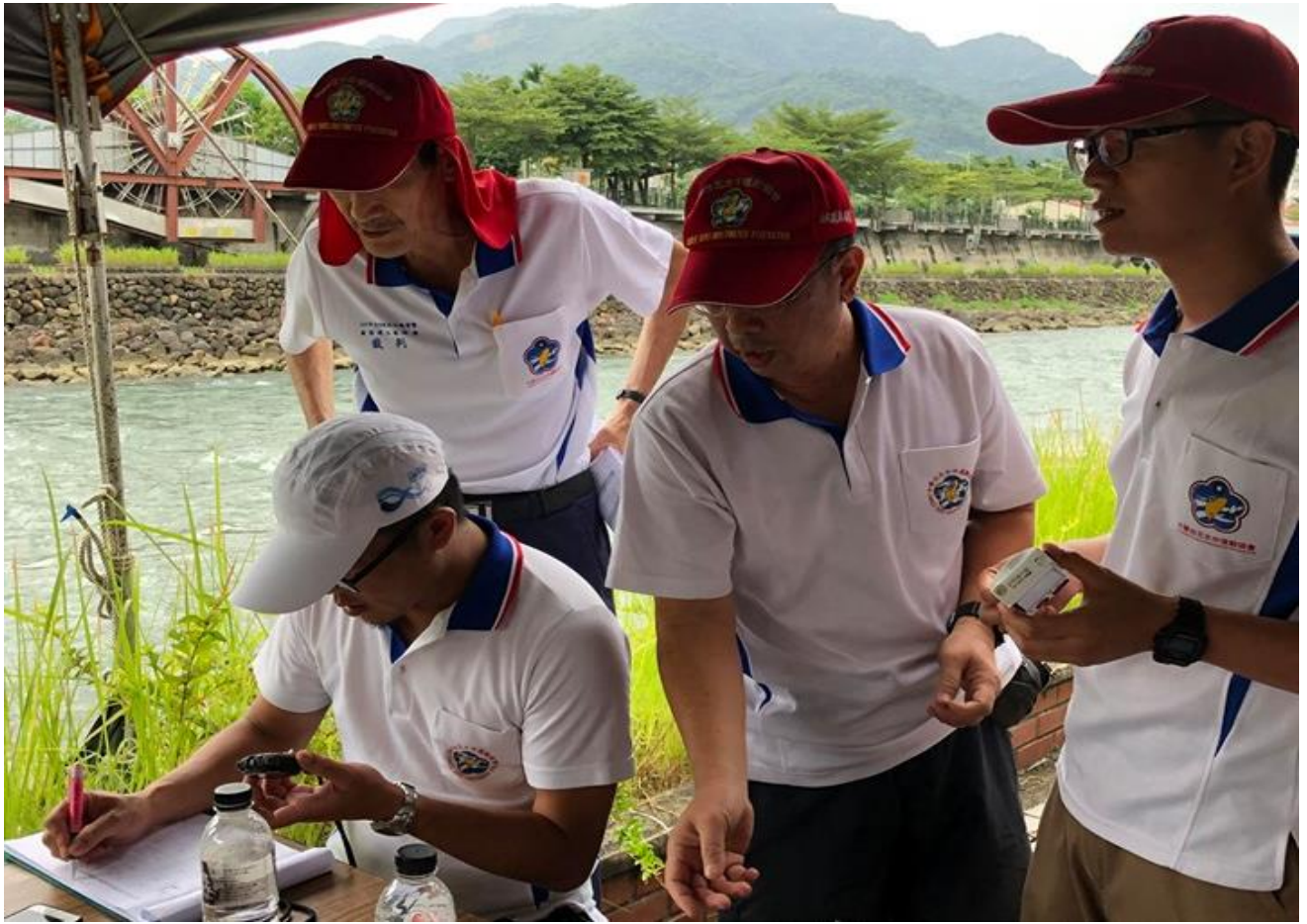
終點裁判紀錄成績